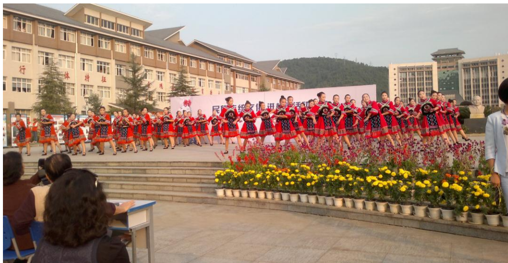
参会代表到湘西职院观看土家摆手舞表演