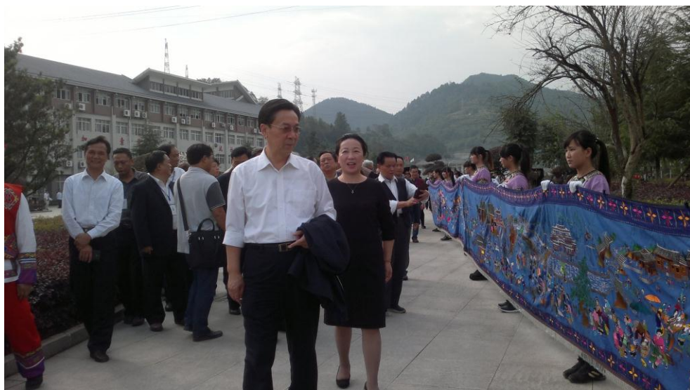
参会代表到湘西职院参观苗绣

23日下午，全省市州 140 名与会人员来到湘西民族职业技术学院参观现场，实地考察我院关心下一代工作，并观看了学院民族传统文化进校园展演。