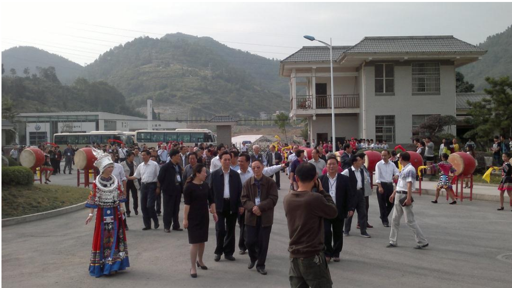
参会代表到湘西职院考察

10月23日至24日，全省第十四次市州关工委主任会议在我州召开，总结交流工作经验，安排部署下步工作。省委常委、省委组织部部长、省关工委名誉主任郭开朗，省关工委主任戚和平，省关工委原主任沈瑞庭，省关工委副主任高锦屏、蔡力峰、罗海藩、王四连、范多富、石玉珍、常世雄、瞿宝元，省关工委副主任兼秘书长乐奕及州领导郭建群、刘小明、曹普华在主席台就座。